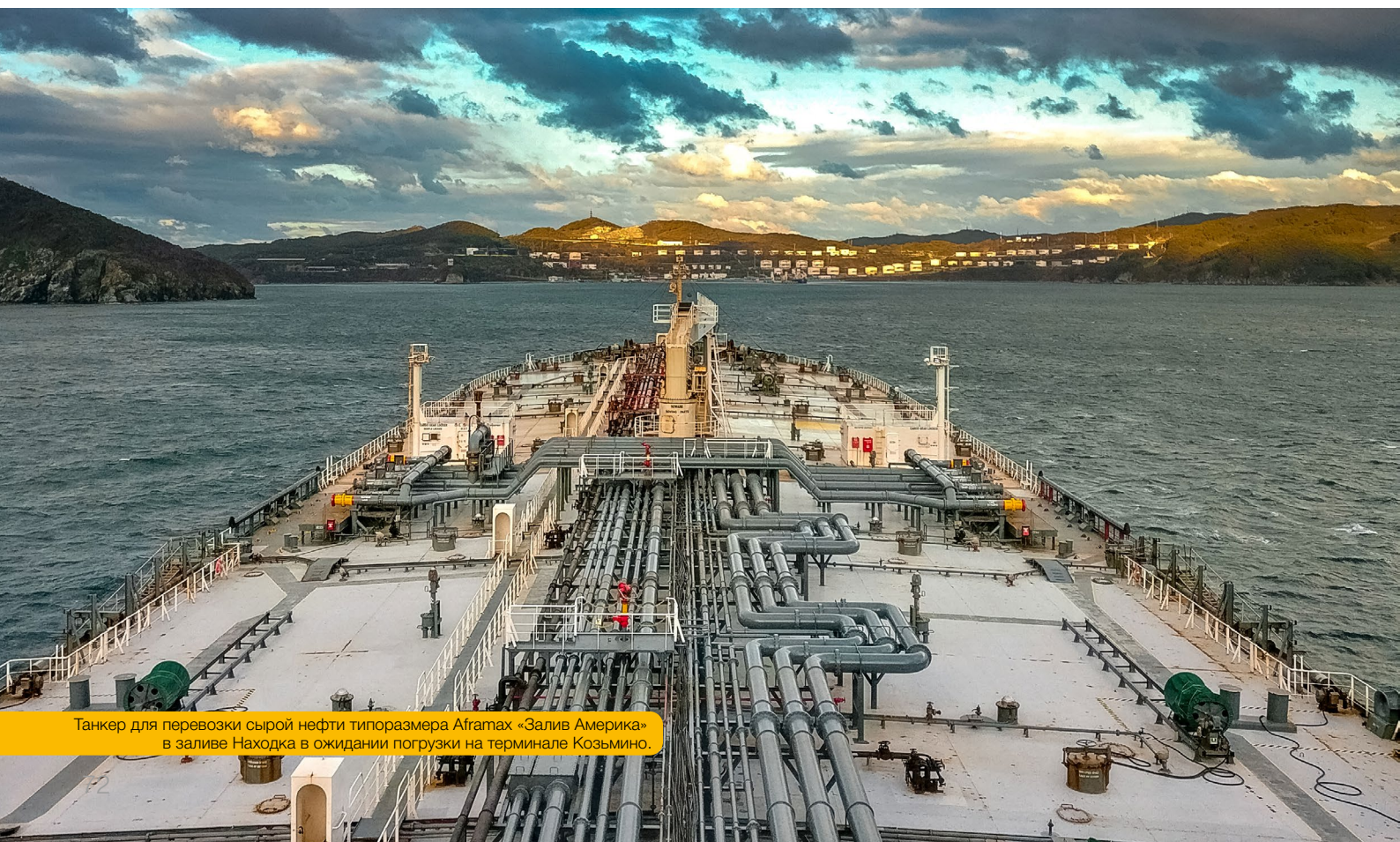
Танкер для перевозки сырой нефти типоразмера Aframax «Залив Америка» в заливе Находка в ожидании погрузки на терминале Козьмино.

Основные принципы корпоративного управления в Российской Федерации определены Кодексом корпоративного управления, одобренным Банком России (далее – Кодекс КУ) и рекомендованным к применению акционерными обществами. По результатам проведенной обществом оценки соблюдения рекомендаций Кодекса КУ определено, что ПАО «Совкомфлот» соблюдает большинство рекомендаций Кодекса КУ.